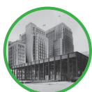
Aire de services bancaires en construction, Toronto-Dominion Centre, août 1967 Archives du Groupe Banque TD P10-0158 Panda & Associates 67203-11