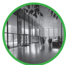
TD Tower Lobby Interior, Toronto Dominion Centre, 1970 Archives du Groupe Banque TD 77-257-9