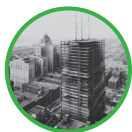
Tour Toronto-Dominion s'élevant derrière l'hôtel Royal York, septembre 1965 Archives du Groupe Banque TD P10-0080 Panda & Associates 64603-44