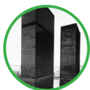
Vue aérienne du Toronto-Dominion Centre, vers 1969 Archives du Groupe Banque TD 77-252-8 Photographie de Ron Vickers 16756-M73